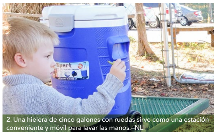
2. Una hielera de cinco galones con ruedas sirve como una estación conveniente y móvil para lavar las manos.—NLI

Contar con asientos para los proveedores apoya las relaciones sociales positivas entre los niños y además provee comodidad. Los bancos tradicionales (1), se pueden mezclar con piedras (6), hamacas y otras instalaciones creativas para que los proveedores y los niños puedan sentarse, apoltronarse o apoyarse.