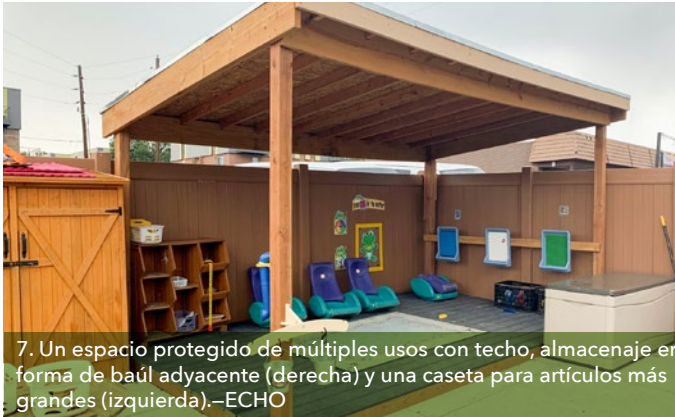
7. Un espacio protegido de múltiples usos con techo, almacenaje en forma de baúl adyacente (derecha) y una caseta para artículos más grandes (izquierda).

Contar con almacenamiento cercano es esencial para los juegos y el aprendizaje al aire libre. Las artículos deben ubicarse a la mano para enriquecer las actividades asociadas con espacios específicos y además pueden contener materiales de desinfección o limpieza de manera segura lejos de los niños. Cajas de almacenamiento móviles y otras unidades semejantes estándares asequibles pueden servir dichos propósitos bien (7).