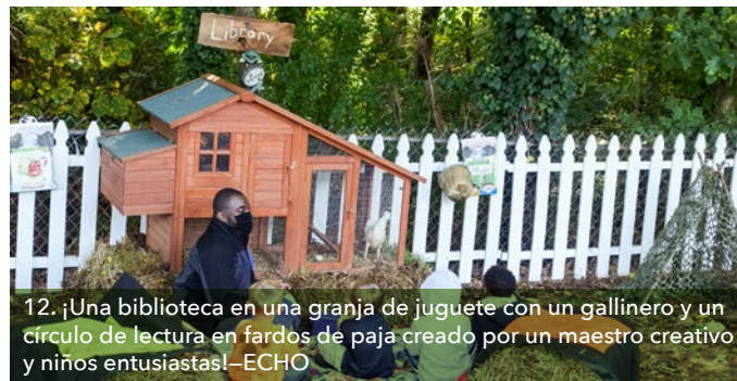
12. ¡Una biblioteca en una granja de juguete con un gallinero y un círculo de lectura en fardos de paja creado por un maestro creativo y niños entusiastas! –ECHO