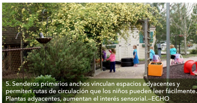
5. Senderos primarios anchos vinculan espacios adyacentes y permiten rutas de circulación que los niños pueden leer fácilmente. Plantas adyacentes, aumentan el interés sensorial.—ECHO

puede ser un riesgo para la salud. Se debe compensar el sol con la sombra, lo cual es clave para la comodidad veraniega. Se puede crear un equilibrio creando áreas dispersas de sombra que protegen a los niños permitiendo, a la vez, la penetración parcial del sol. Si bien la plantación de árboles es una solución a largo plazo para obtener sombra con valor educativo adicional, durante la pandemia una mezcla de toldos, carpas, sombrillas, pérgolas, cenadores/gazebos y estructuras de techo, pueden proveer protección del sol, de la lluvia y del viento (4, 7).