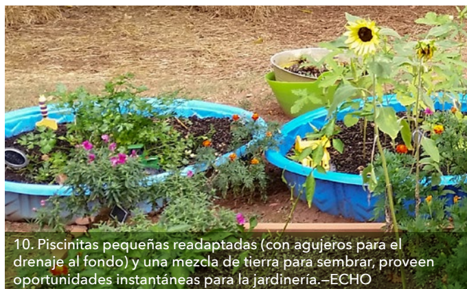
10. Piscinitas pequeñas readaptadas (con agujeros para el drenaje al fondo) y una mezcla de tierra para sembrar, proveen oportunidades instantáneas para la jardinería.

Para los centros donde el espacio con licencia es reducido, considere espacios contiguos más allá del área con licencia que pueden ser encerrados y readaptados temporalmente, incluso bosques (11), campos adyacentes o, como último recurso, una sección de una playa de estacionamiento. Tomando excursiones a pie a los parques cercanos, con el consentimiento paterno, podría llegar a ser una actividad semanal cautivadora.