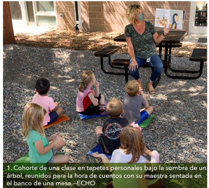
1. Cohorte de una clase en tapetes personales bajo la sombra de un árbol, reunidos para la hora de cuentos con su maestra sentada en el banco de una mesa.—ECHO

Crear grupos o “cohortes”. Dados los desafíos para los niños pequeños del distanciamiento físico individual y del uso de mascarillas, ambos la AAP y el CDC sugieren establecer grupos estables de niños y adultos, denominados ‘cohortes’. Este abordaje, busca prevenir la mezcla entre grupos