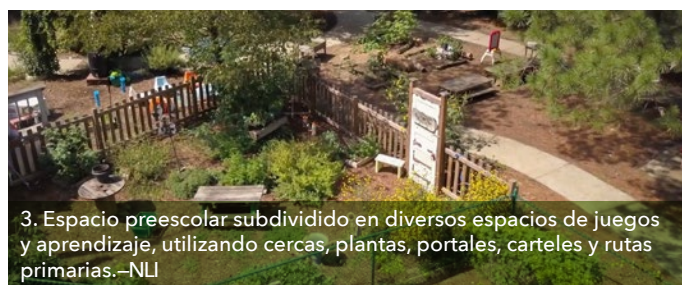
3. Espacio preescolar subdividido en diversos espacios de juegos y aprendizaje, utilizando cercas, plantas, portales, carteles y rutas primarias.—NLI