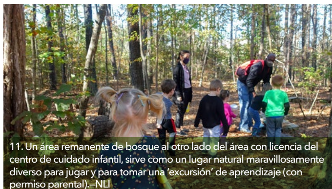
11. Un área remanente de bosque al otro lado del área con licencia del centro de cuidado infantil, sirve como un lugar natural maravillosamente diverso para jugar y para tomar una 'excursión' de aprendizaje (con permiso parental). –NLI