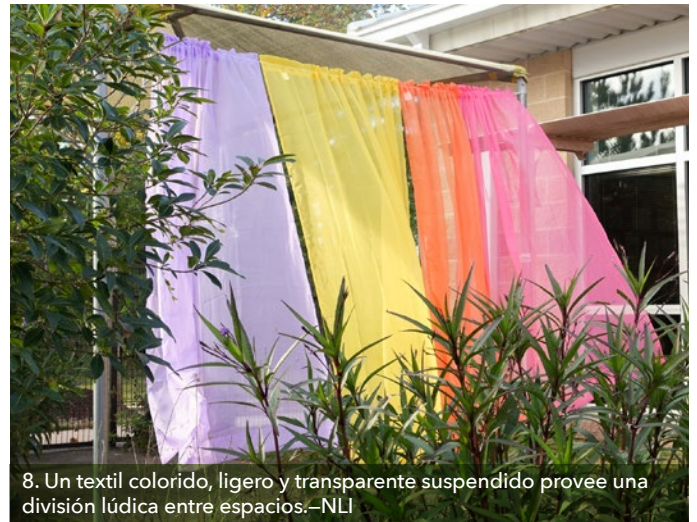
8. Un textil colorido, ligero y transparente suspendido provee una división lúdica entre espacios.—NLI

Huertas de frutas y verduras en conformidad con los reglamentos estatales en materia de cuidado infantil y salud, es una manera barata de introducir la naturaleza que apoya la salud y aumenta el valor del aprendizaje a lo largo del año en ciertos lugares, donde es posible cultivar verduras en la 'estación cálida' y 'estación fría'. Use contenedores reconvertidos para la instalación rápida (10). Para los programas en los estados del sudeste de Estados Unidos, véase la Childcare Gardening Series [Serie sobre la jardinería en el cuidado infantil] de la NLI/Extensión Cooperativa. Otros recursos útiles, incluyen Making Newspaper Seedling Pots