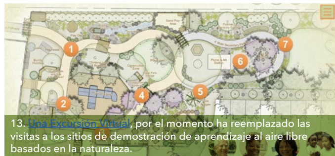
13. Una Excursión Virtual, por el momento ha reemplazado las visitas a los sitios de demostración de aprendizaje al aire libre basados en la naturaleza.

Los programación innovadora del juego y el aprendizaje, puede ayudar a los proveedores a involucrar a los niños en nuevos espacios al aire libre durante períodos de tiempo cada vez más largos (12). Especialmente en respuesta al COVID-19, los proveedores pueden beneficiarse del entrenamiento, herramientas y recursos de apoyo, para alentar la dedicación de más tiempo agradable afuera durante una parte sustancial del día. Apoyo para el desarrollo profesional en línea, como ser a través de seminarios web, entrenamientos y redes de profesionales, está disponible a través de ECHO y NLI (13).