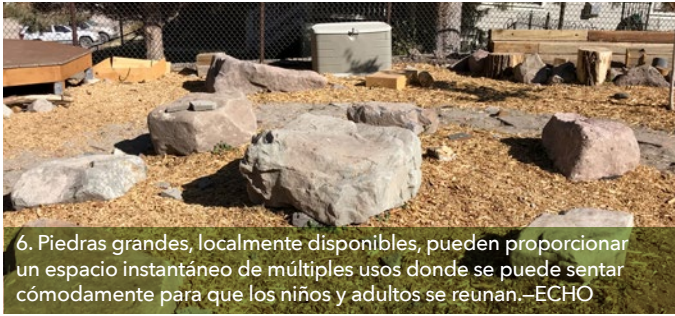
6. Piedras grandes, localmente disponibles, pueden proporcionar un espacio instantáneo de múltiples usos donde se puede sentar cómodamente para que los niños y adultos se reúnan.—ECHO