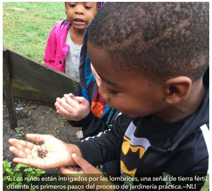
9. Los niños están intrigados por las lombrices, una señal de tierra fértil, durante los primeros pasos del proceso de jardinería práctica.—NLI